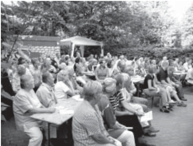
Ein jährlicher Höhepunkt: Brückenbaufest in der Jägerstrasse

Ein junger Mann aus dem Landkreis Celle kam zu uns, dessen Ehefrau kurzfristig wegen Versandhausbetruges inhaftiert wurde. Kurz vor der Inhaftierung verlor er seinen