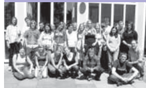
Öffentlichkeitsarbeit: Projekttag mit Mitarbeitern und Betroffenen in Wolfsburg

Darüber hinaus hilft uns Öffentlichkeitsarbeit, Spender und ehrenamtliche Mitarbeiterinnen und Mitarbeiter zu gewinnen, und sie am gesellschaftlichen Auftrag der Straffälligenhilfe zu beteiligen. Besonders wichtig waren uns im vergangenen Jahr die Veranstaltungen und Begegnungen mit jungen Menschen in Schulen, beim Evangelischen Kirchentag, in Kirchengemeinden bis hin zu Projekttagen in Wolfsburg. In den Gesprächen mit Jugendlichen wird deutlich, dass diese z.T. über Erfahrungen mit Kriminalität verfügen. Es bleibt zu hoffen, dass die Gespräche mit Langzeitinhaftierten positive Wirkung zeigen