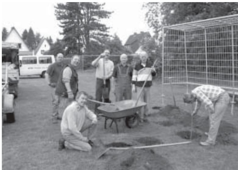
Wir bauen einen Spielplatz: Brückenbauer und Ortsrat Celle-Neuenhäusen

Zusammen mit Inhaftierten, Haftentlassenen und Angehörigen findet unter der Mitarbeit von haupt- und ehrenamtlichen Mitarbeiterinnen und Mit-