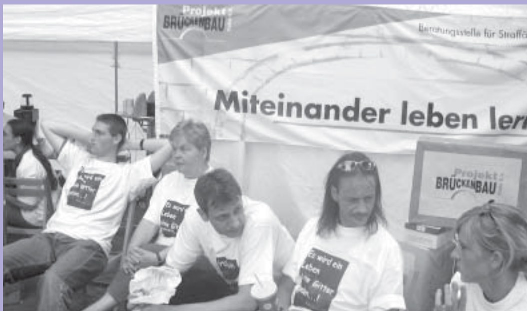
Info-Stand von Projekt Brückenbau auf dem Landesjugendcamp der Evangelischen Jugend

5. September Brückenbau- fest – Alle Leser sind herzlich eingeladen!