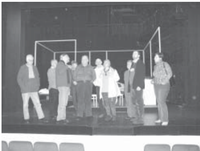
Brückenbauer auf Exkursion: Hinter den Kulissen des Schlosstheaters

erst einmal gut, darüber zu „quatschen“ – Frust ablassen, zuhören und dann gemeinsam eine Strategie entwickeln, um die nächste Zeit zu „überleben“.